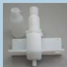
ドッキング・ステーション